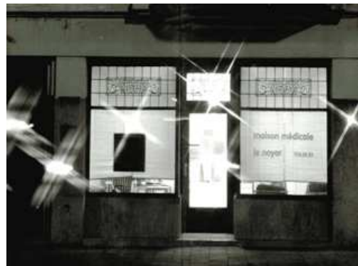
Façade de la maison médicale rue du Noyer 1978

Parfois j'ai des appréhensions pour l'avenir de la maison médicale, et plus globalement des maisons médicales, car nos responsables politiques, fixés sur une approche essentiellement économique et restrictive de la santé, favoriseront une médecine de l'urgence et de la haute technicité, tremplin vers une médecine duale, et ils pénaliseront les maisons médicales ainsi que d'autres garants de soins de santé pour tous, comme les mutuelles, par exemple.